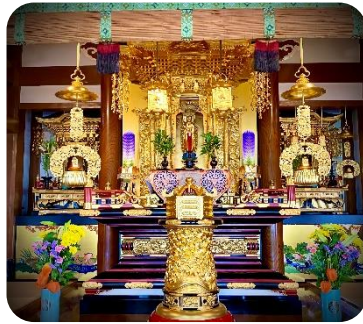
本堂お盆のお飾り