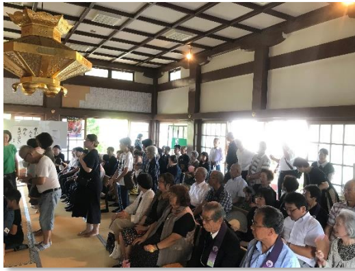
2019年の盆法座の様子です